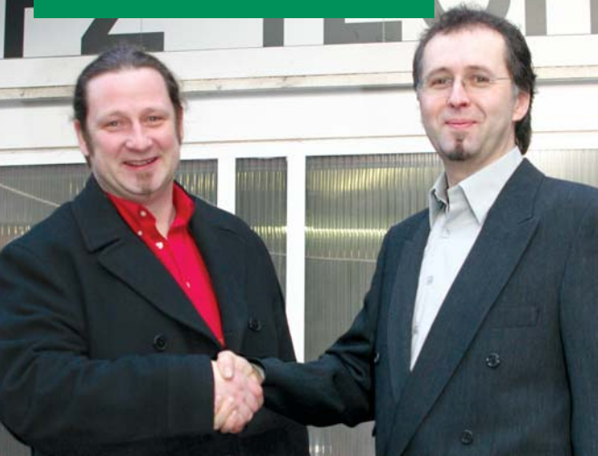
Partner für Sicherheit