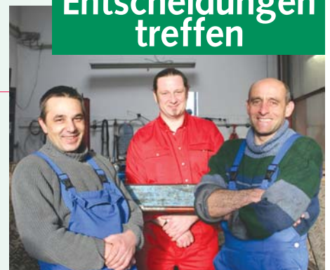
Malteser bringen Sicherheit und frischen Wind